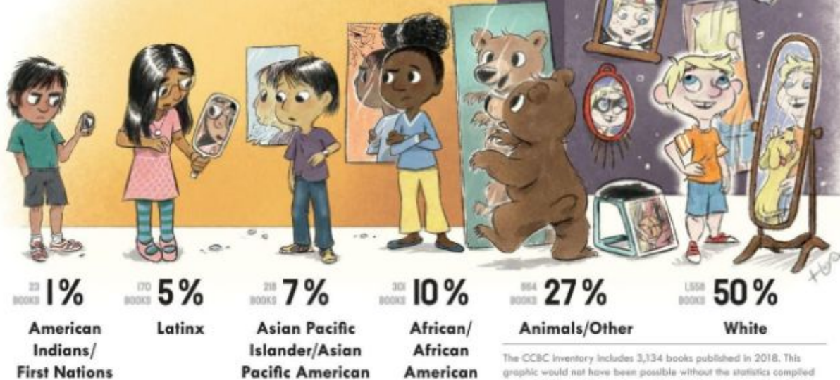
Illustration by David Huyck, in consultation with Sarah Park Dahlen Released under a Creative Commons BY-SA license: https://creativecommons.org/licenses/by-sa/4.0/

Percentage of books depicting characters from diverse backgrounds based on the 2018 publishing statistics compiled by the Cooperative Children's Book Center, School of Education, University of Wisconsin-Madison: ccbc.education.wisc.edu/books/pcstats.asp